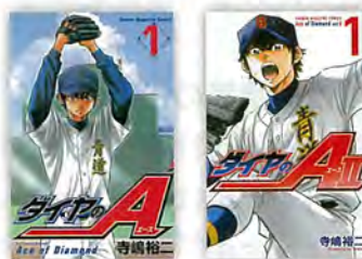
『ダイヤのA』第1巻と『ダイヤのA act II』第1巻 寺嶋裕二/講談社

強豪校で、エースを目指してひたむきな努力を続ける主人公・沢村栄純の苦悩と葛藤、ライバルとの切磋琢磨を描く。練習風景や戦術、野球理論などは非常に現実的で、多くのプロ野球選手のバイブルともなっている。ピッチャーのコンディションや戦況等、全体を見てピッチングを組み立てていくキャッチャーがフォーカスされているのもポイント。名キャプテン・名監督も数多く登場。『ダイヤのA』全47巻、『ダイヤのA act II』全34巻。