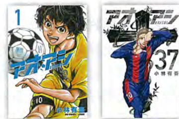
『アオアシ』第1巻と第37巻 小林有吾/小学館

家族への愛とハングリー精神にあふれた地方出身の少年・青井葦人が主人公。プロサッカー選手の育成を担うJユースで、全国から集う実力者にもまれ、自身の技術力不足や突然のポジション転向(FW→DF)を告げられながらも、チームメイトや対戦相手から貪欲にスキルを吸収して、DFとして、そして「司令塔」としての才能を開花させていく姿を生き生きと描く。既刊37巻。