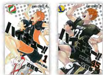
『ハイキュー!!』第1巻と第45巻 (c)古舘春一/集英社

身長の高さが大きなアドバンテージとなるバレーボールにおいて、低身長でありながら高い跳躍力と抜群の運動神経を誇る主人公・日向翔陽の成長を軸に、ライバルとの絆やバレーボールにかける選手たちの情熱を丁寧に描いた作品。「花形」のスパイカーのみならず、めまぐるしく展開が変わるコート上で瞬時に「攻め」の最適解を見出してトスを上げるセッターにスポットが当てられているのも特徴。全45巻。